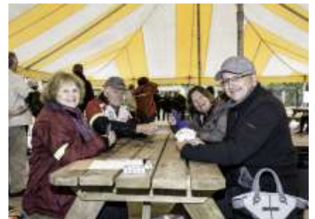
Joueurs de cartes