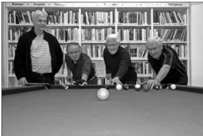
L'Ambiance février 2012 page 10