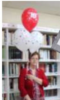
Responsable: Angèle Jacob