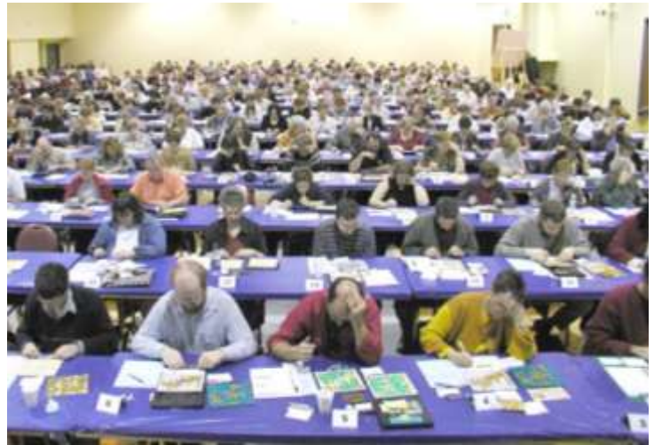
Un tournoi de Scrabble duplicate

L'avantage du jeu duplicate sur le jeu dit « classique » c'est que tous les joueurs jouent avec les mêmes lettres. Les lettres choisies par l'animateur sont affichées sur un grand tableau positionné en avant de la salle, et tous les joueurs sortent de leur jeu, les mêmes lettres choisies par l'animateur. L'utilisation des lettres « toujours 7 », se fait de la même façon que le jeu de Scrabble ordinaire.